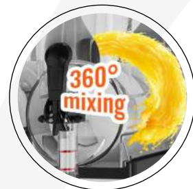
Manija gira 360° Regula la cantidad deseada.

Nuestro sistema de refrigeración utiliza refrigerante R290 y tiene excelentes características para un enfriamiento rápido y una producción eficiente de granizados.