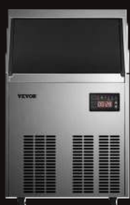
Máquinas de hielo