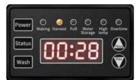
Panel LCD inteligente

Esta máquina de hielo adopta tecnología de lavado automático para lograr una limpieza completa con manos libres.