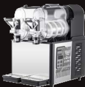
Máquinas de Granizado