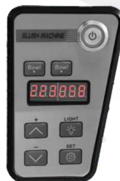
Panel de control con pantalla digital