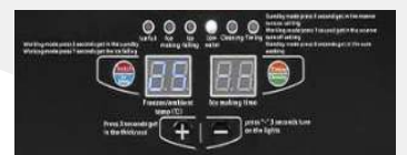
Panel LCD inteligente