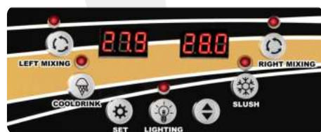
Panel de selección entre los modos de bebida fría y aguanieve

Con el sistema de cilindro anticongelante, la máquina puede arrancar y detenerse automáticamente para resolver el problema de congelamiento del cilindro, extendiendo así la vida útil de la máquina.