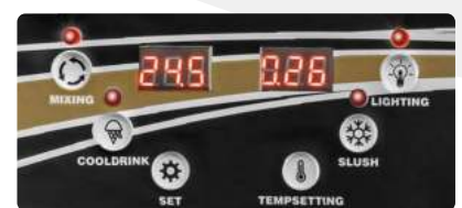
Panel de selección entre los modos de bebida fría y aguanieve

Diseñada con la función de conservación, puede configurar la temperatura desde su panel de control para mantener frescos los granizados.