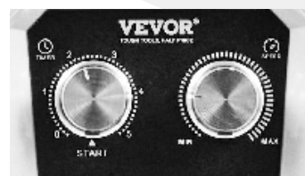
Nivel de velocidad ajustable