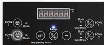
Panel de control inteligente Selección de múltiples bebidas.

Fabricada en acero inoxidable de alta calidad apto para uso alimentario, que tiene una excelente resistencia a la corrosión y al óxido, soporta alta presión y es fácil de limpiar.