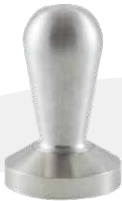
Tamper 51 mm aluminio