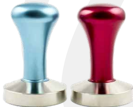
Tamper Zoi + Chloe colores 58 mm