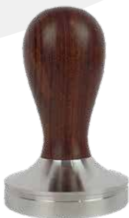
Tamper stainless mango madera 58 mm