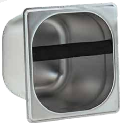
Knock box de 4"

Posee una barra fuerte de hule para golpear el portafiltros.