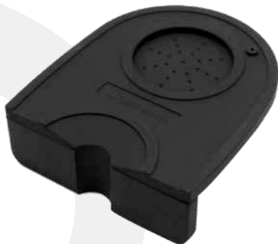
Base de goma