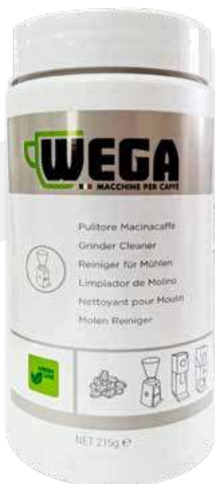
Limpiador Wega para máquina de café espresso