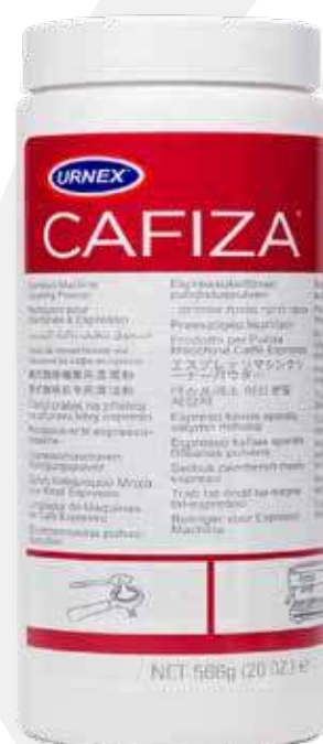
Urnex Cafiza pastillas de limpieza