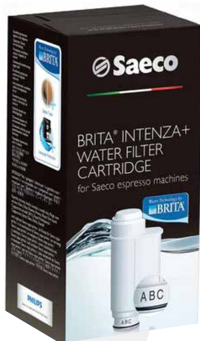
Philips Saeco Brita Intenza + Filtro agua para máquinas de café espresso