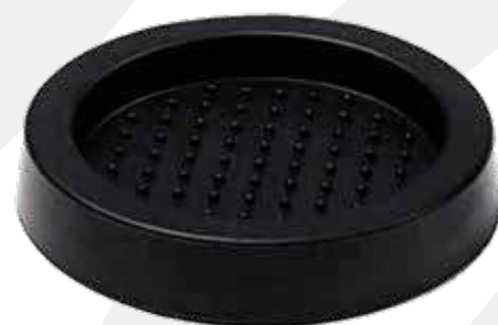
Base para tamper