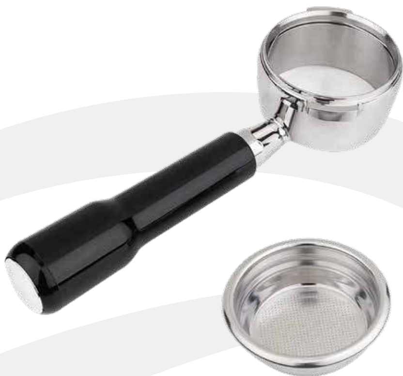
Portafiltro 1 café