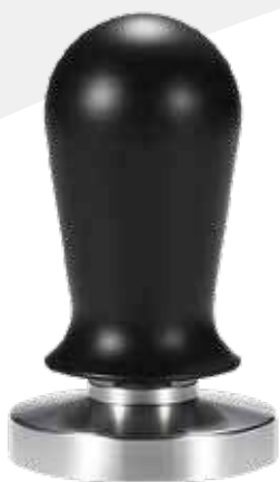
Tamper 58 mm con resorte consistente