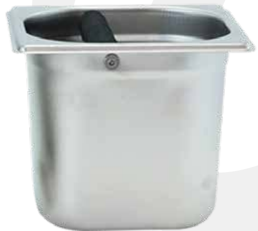
Knock box de 6"