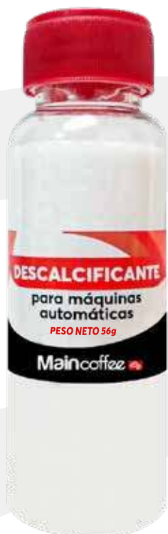
Descalcificante para máquina de espresso