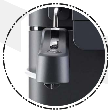
Dispensador de leche EXTERNO

Un diseño atrevido. Una imagen elegante, componentes profesionales y funcionales, dispone de una interfaz intuitiva con iconos, cuenta con cuchillas cónicas de acero y dispensador ajustable en altura.