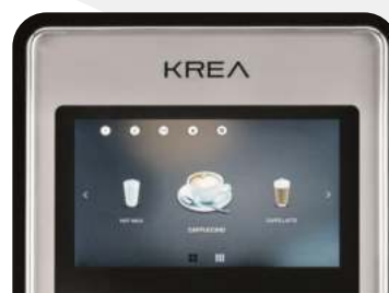
Pantalla táctil HD de 7".