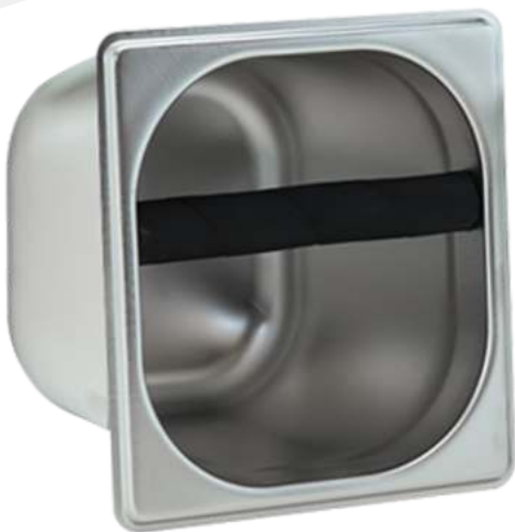
Knock box de 4"

Posee una barra fuerte de hule para golpear el portafiltros.