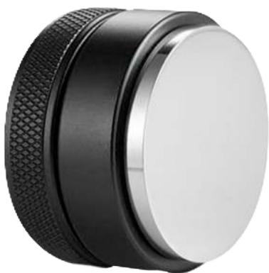
Distribuidor de nivel café 58 mm