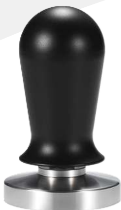
Tamper 58 mm con resorte consistente