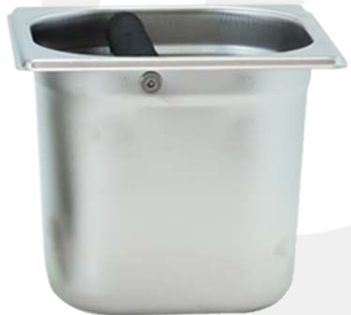
Knock box de 6"