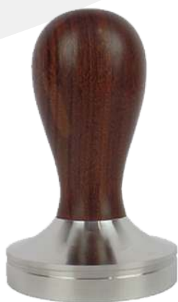
Tamper stainless mango madera 58 mm