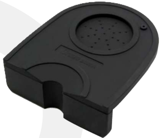
Base de goma