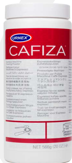
Urnex Cafiza pastillas de limpieza