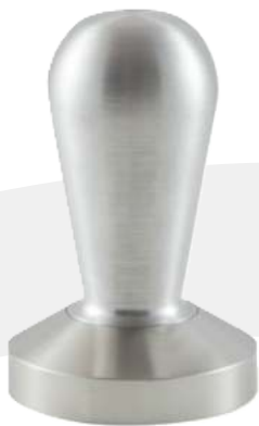
Tamper 51 mm aluminio