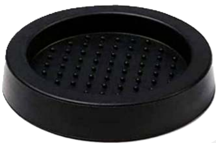
Base para tamper