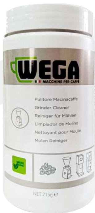
Limpiador Wega para máquina de café espresso

Mejora el sabor y el rendimiento: limpia profundamente dentro de la cafetera mediante la eliminación de cal y otros depósitos minerales de agua dura, mejora el sabor del café y prolonga la vida útil de la máquina, evita la corrosión y otras acumulaciones pegajosas.