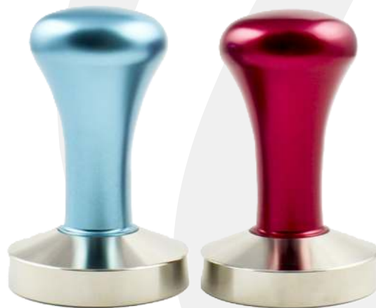
Tamper Zoi + Chloe colores 58 mm