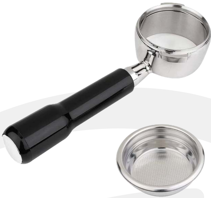
Portafiltro 1 café