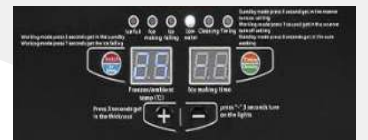
Panel LCD inteligente