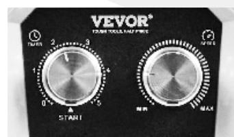
Nivel de velocidad ajustable