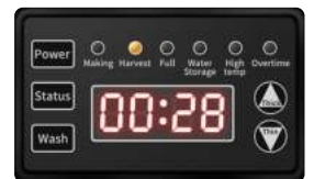
Panel LCD inteligente

Esta máquina de hielo adopta tecnología de lavado automático para lograr una limpieza completa con manos libres.