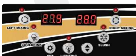
Panel de selección entre los modos de bebida fría y aguanieve