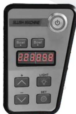
Panel de control con pantalla digital